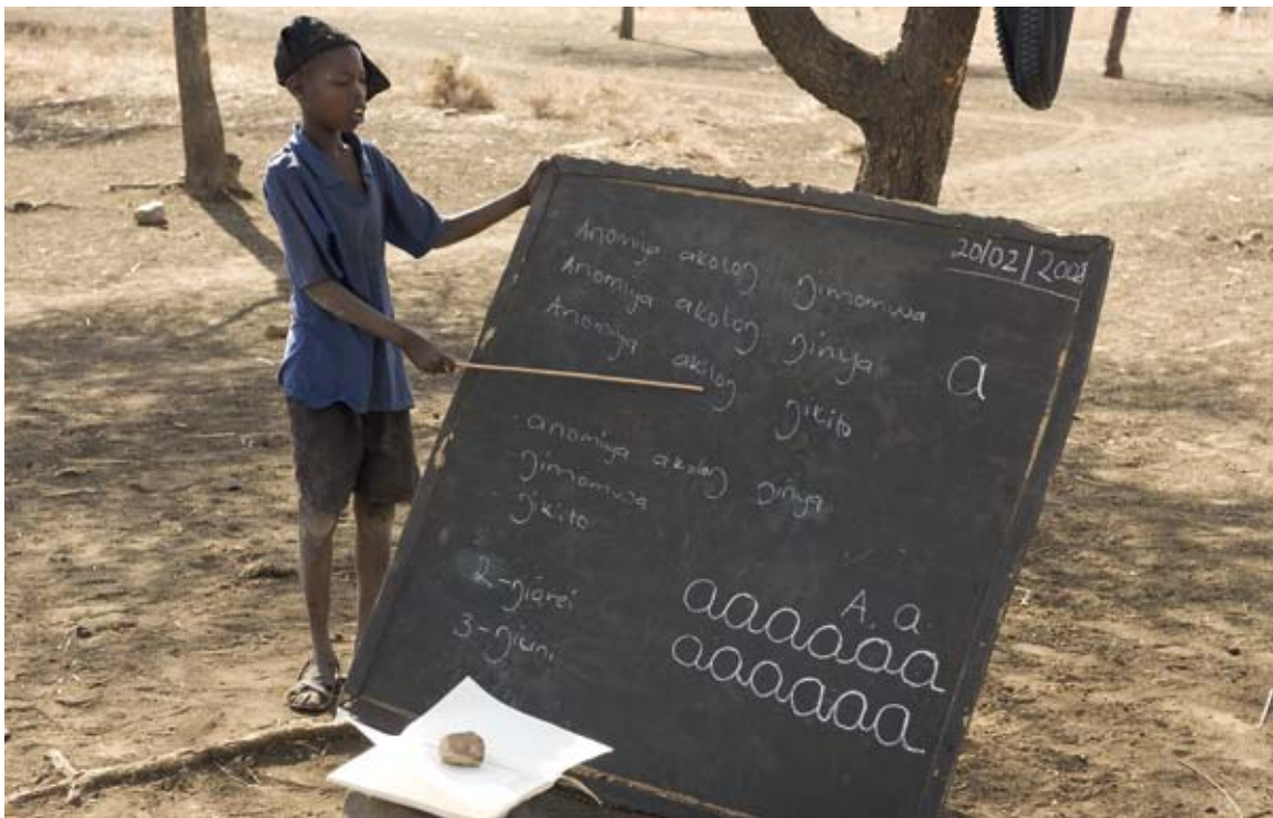
In Uganda benutzen Lehrer den Zeigestock oft für die körperliche Züchtigung

Mit dem Sprichwort „Wer mit der Rute spart, verzieht das Kind“ wird in Uganda gerne körperliche Züchtigung gerechtfertigt. Seit 2016 ist die Prügelstrafe in Schulen – aber nicht im privaten Bereich – gesetzlich verboten. Das Gesetz besagt, dass jedes Kind das Recht hat, vor allen Formen der Gewalt, also auch physischer und psychischer Misshandlung, geschützt zu werden. Es ist nicht der erste Versuch, Gewalt an Schulen zu unterbinden. Im August 2015 verhängte das Bildungsministerium ein „Verbot aller Arten von Gewalt gegen Kinder in Schulen, Instituten und Colleges“ und verwies dabei auf die Verfassung und verschiedene