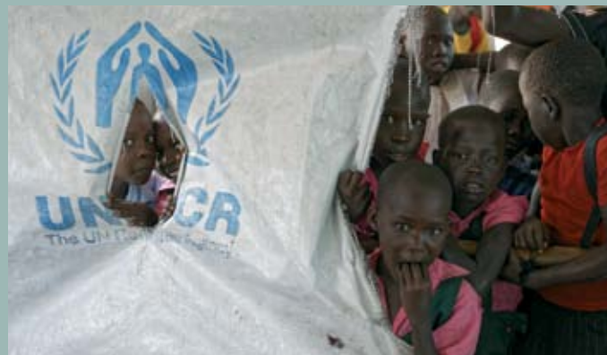
Flüchtlingskinder in einem Lager in Norduganda.

Die ökonomische Lage wird immer schlechter. Die Inflation schießt in die Höhe und die Lebensmittelversorgung ist unzuverlässig. Schätzungen zufolge ist die Ernährung von zwei Fünfteln der Bevölkerung ernsthaft gefährdet. Zu denen, die Hunger am empfindlichsten trifft, gehören die Kinder. (pm)