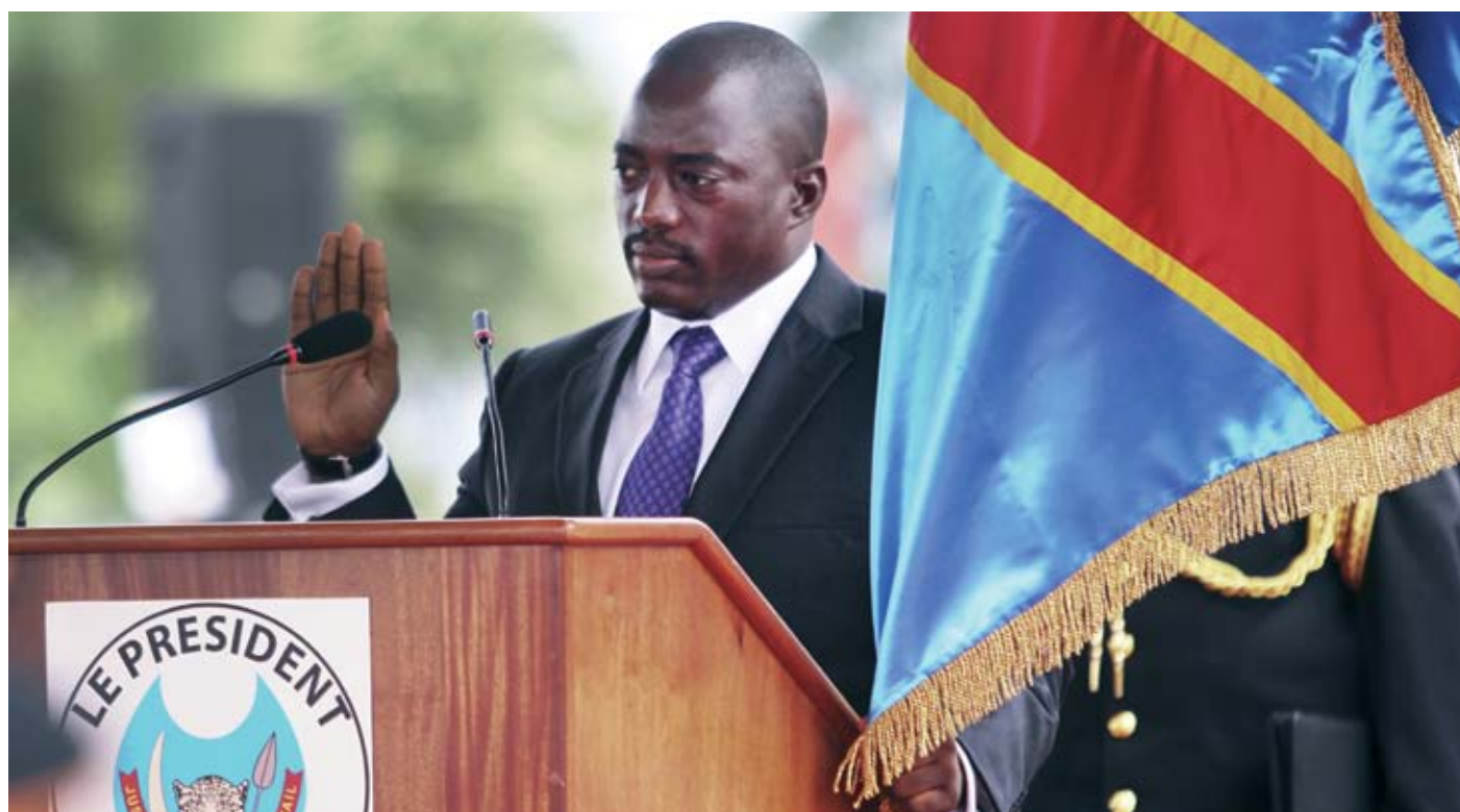
Im Kongo steht der Machtwechsel noch bevor: Präsident Joseph Kabila nach seiner umstrittenen Wiederwahl 2011.