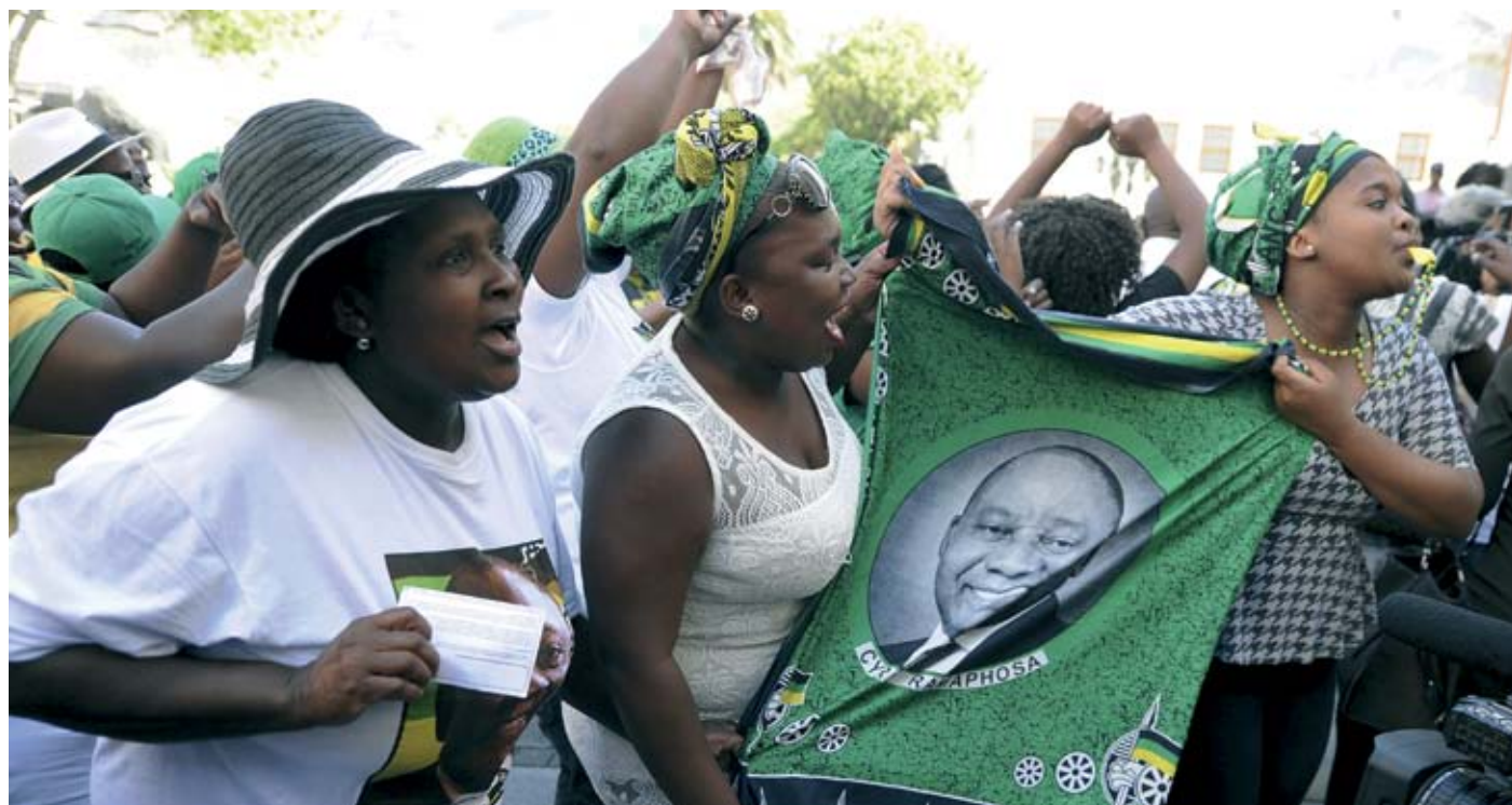
Anhängerinnen von Cyril Ramaphosa feiern seine Wahl zum Präsidenten Südafrikas.

sich die Lage zu, und die Forderungen nach Zumas Rücktritt mehrten sich, um seinem Nachfolger in der Partei auch den Weg ins höchste Staatsamt freizumachen. Nach einem ähnlichen Tauziehen wie einige Monate zuvor in Simbabwe warf Zuma am 14. Februar das Handtuch, um einem Misstrauensvotum im Parlament zuvorzukommen.