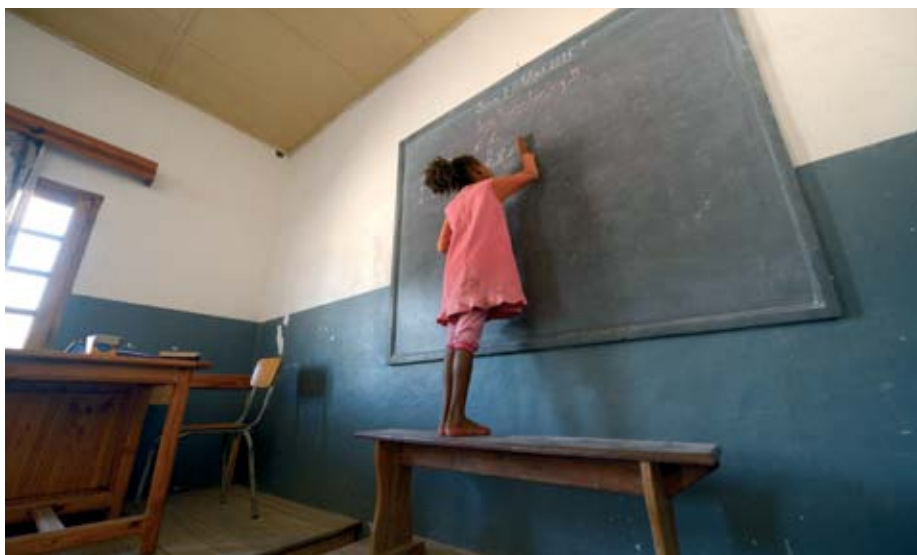
Schulkind in Madagaskar.

Niemand zweifelt daran, dass Wissen immer wichtiger wird. Afrika muss seine demografischen Chancen nutzen und schnell Wissensgesellschaften aufbauen. Der Kontinent muss auf allen Feldern kompetent und wettbewerbsfähig werden. Ohne den Ehrgeiz, die Weltspitze zu erreichen, werden wir nie zur Weltspitze gehören.