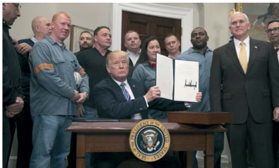
Trump lud Stahlarbeiter ein, bei der Unterschrift des Zollerlasses zuzuschauen.

Zusätzliche Spannungen drohen, wenn die US-Regierung die Umsatzsteuer von drei Prozent, die die EU Internet-Unternehmen abverlangen will, als Handelshemmnis bewertet. Richtig ist, dass sie die