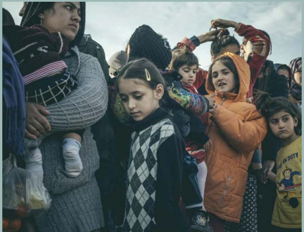
Unbegleitete minderjährige Flüchtlinge sind besonders verletzlich und schutzbedürftig: Kinder im Idomeni-Flüchtlingslager an der griechisch-mazedonischen Grenze.

Mariyana Berket von der Organisation für Sicherheit und Zusammenarbeit in Europa (OSZE) sagt, dass „unbegleitete Minderjährige aus Konfliktregionen die mit Abstand gefährdetste Gruppe unter den Flüchtlingen“ bilden. (rb)