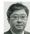
YASUYUKI SAWADA ist der Chefvolkswirt der Asiatischen Entwicklungsbank (Asian Development Bank – ADB).

https://www.adb.org/sites/default/files/publication/379401/asean-fourth-industrial-revolution-rci.pdf