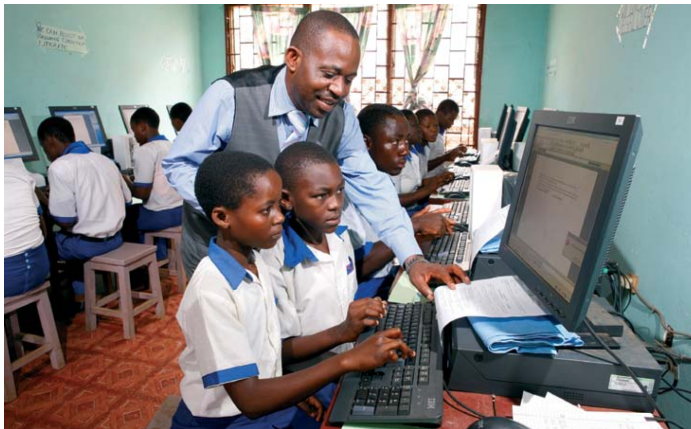
Computerunterricht in einer Schule in Kamerun.