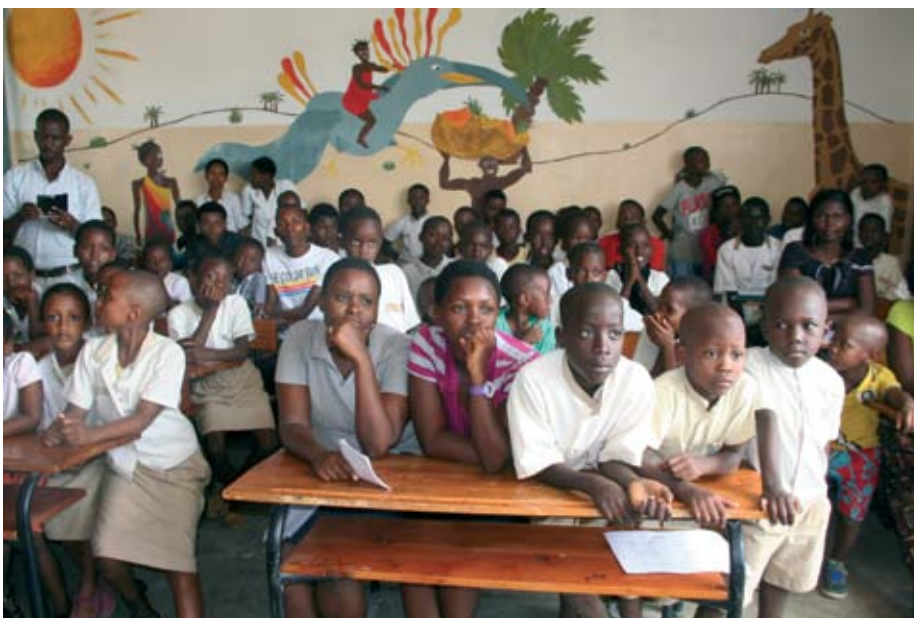
Kinder in der Schule der Fondation Stamm.

Ist ein Mädchen Halbwaise und bekommt eine Stiefmutter, wird sie oft schlecht behandelt und als Arbeitskraft ausgenutzt. Im Falle eines Stiefvaters besteht die Gefahr der Vergewaltigung und einer ungewollten Schwangerschaft. Die Lage ist für ein schwangeres Mädchen dramatisch, denn sie wird auch noch von der Familie verstoßen.