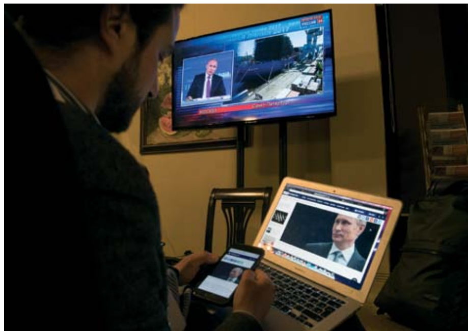
Live-Übertragung auf verschiedenen Kanälen.