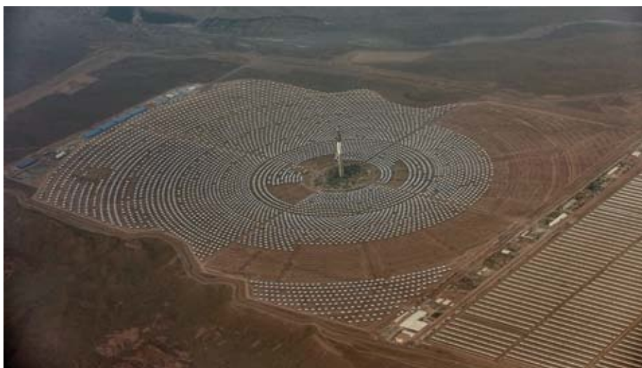
Deutschland hat den Bau des marokkanischen Solarkraftwerks Noor 3 in Ouarzazate mit Krediten unterstützt.

https://www.die-gdi.de/uploads/media/DP_5.2018.pdf