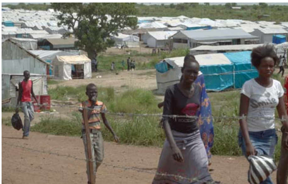
UN-Lager in Juba 2015.

Wie tausende Binnenflüchtlinge (internally displaced persons – IDPs) lebt Lam