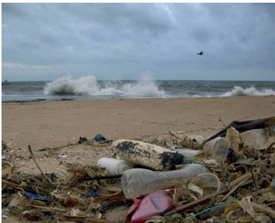
Nicht nur Plastikmüll bedroht die Ozeane, sondern auch – weniger sichtbar – Stickstoff und Phosphor. Strand in Sri Lanka.

In Teil 2, der eine neue Aufklärung fordert und den Verfassern zufolge den revolutionärsten Part des Berichts darstellt, geht es um Umweltethik und die Religionen der Welt. Die Grundthese lautet, dass die heutigen Religionen und Denkmuster eben-