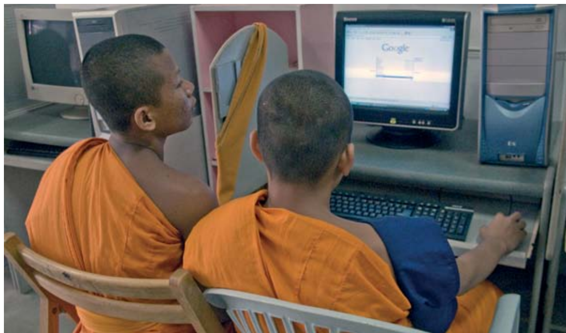
Google-Suche in einem thailändischen Internetcafé.

Park: Wichtig ist auch, ob asiatische Volkswirtschaften ihre eigenen Plattformfirmen hervorbringen können. Die SMEs profitieren von den bestehenden Möglichkeiten, aber ihre Vorteile wären vielleicht noch größer, wenn zwischen Plattformen mehr Wettbewerb herrschen würde. China und Indien haben jeweils mehr als eine Milliarde Menschen, und dort entstehen heimische Plattformen. Diese Länder können vielleicht auch den nötigen Rechtsrahmen definieren, was für kleinere Volkswirtschaften in Asien vermutlich nicht gilt. In China und Indien wachsen Internetplattformen sogar recht schnell, was unter anderem an Sprachvorteilen liegen dürfte. Aber schützen sie auch die Privatsphäre und das intellektuelle Eigentum ihrer Nutzer? Internationale Standards wären nützlich, um wirkungsvollen Wettbewerb zu schaffen, und zwar sowohl auf den Plattformen als auch zwischen ihnen. Die Regeln sollten obendrein zu Innovation ermuntern.