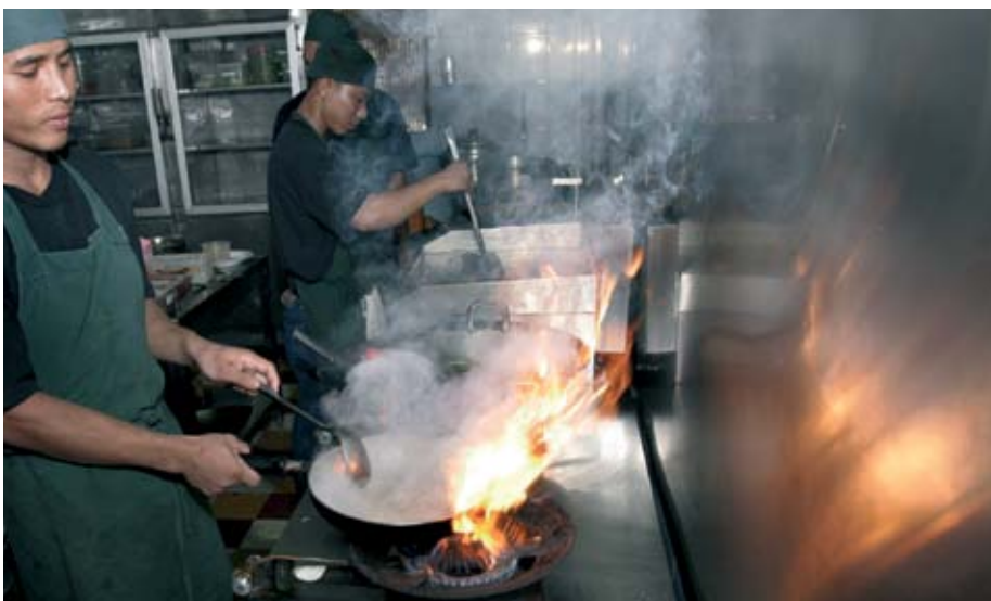
Mith Samlanh betreibt in Phnom Penh ein Restaurant, in dem ehemalige Straßenkinder als Köche oder Kellner arbeiten.