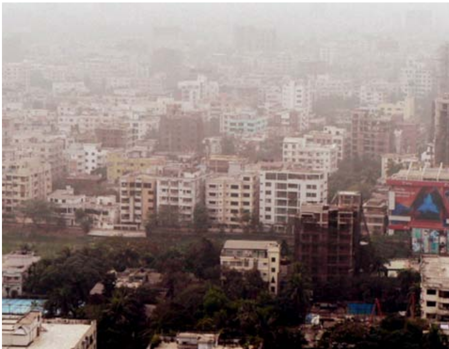
Dhaka wächst schnell.

sitzer zur Aufgabe ihres Eigentums zu bringen. Straßenkinder werden auch für politische Gewalt und sogar für Auftragsmorde engagiert. Ein jugendlicher Teilnehmer an meiner Studie sagte: „Du kannst jemanden anheuern, um jemand anderes für dich zu töten. Du kannst einen Zehnjährigen mit einem Mord beauftragen! Aber du kannst auch größere Kinder anheuern. Das Alter ist nicht festgelegt, es kommt eher darauf an, wie viel du bezahlen kannst. Aber es ist möglich, jemanden für Mord zu bezahlen, es ist sogar sehr einfach.“