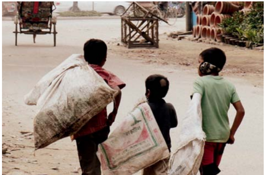
„Die Frage ist, wie diese Kinder besser geschützt werden können.“

Meine Arbeit zeigt, wie Dhakas Straßenkinder von Mastaans angeheuert wer-