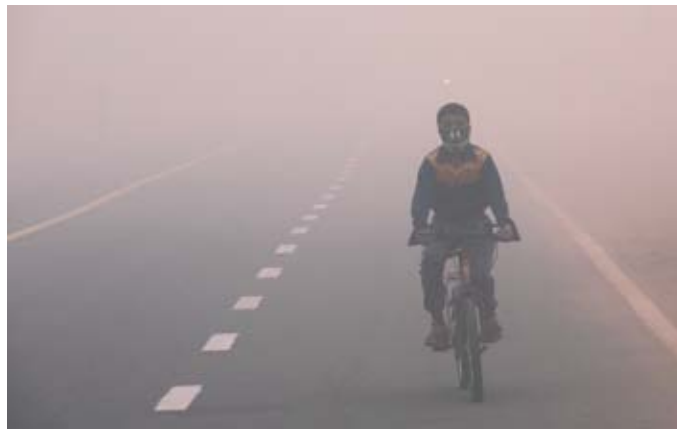
Smog in Delhi.

und Atemprobleme verursachen. Laut einer Studie des Wissenschaftsjournals The Lancet führten die verschiedenen Umweltverschmutzungen 2015 zu 2,5 Millionen Toten in Indien. Das war weltweit die höchste Zahl. Die Weltgesundheitsorganisation erklärte, dass von den 20 weltweit am schlimmsten verschmutzten Städten die Hälfte in Indien liegen. In der Tat ist die Luftqualität von Orten wie Gwalior, Allahabad oder Patna sogar schlimmer als die von Delhi. Dennoch scheint die indische Regierung dies zu igno-